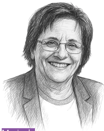
Maria da Penha

Faltou, por exemplo, àquelas feministas, uma articulação com os movimentos de mulheres indígenas, para que a lei trouxesse elementos adequados às situações nas quais vivem as mulheres nas aldeias. Embora vivamos no mesmo país, seus costumes, tradições e crenças se diferenciam das mulheres brancas e negras. Isso significa que o sistema de punição que a lei determina pode não se adequar às indígenas em algumas situações de violência, o que as torna mais vulneráveis diante da violência doméstica, não se sentindo devidamente amparadas por esta legislação.